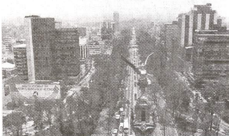
Cada imagen del medio circundante proporciona información sobre la ciudad.

Sin embargo, será en sus últimos artículos cuando Lynch retomará el tema del significado del espacio, su carácter simbólico y su relación con los procesos de identidad, tanto individual como social. De una forma más o menos explícita, la conexión entre significado espacial e identificación social, había sido recogida en textos anteriores ( Notes on City Satisfactions , 1953 y The Image of the City , 1960). Pero es precisamente cuando el autor reflexiona sobre las pautas y orientaciones a tener en cuenta por los diseñadores urbanos cuando esta conexión se hace más evidente ( ¿De qué