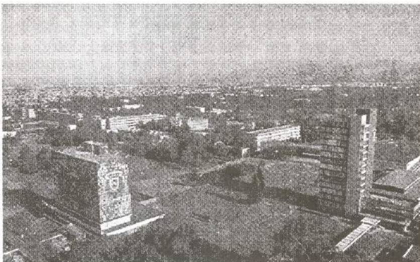
Toda la ciudad cuenta con elementos que tienen un significado para sus habitantes, como la Ciudad Universitaria, símbolo del conocimiento.

De esta manera estructuró lo que denominaba como el plan visual: "un conjunto de recomendaciones y medidas de control relativas a la forma