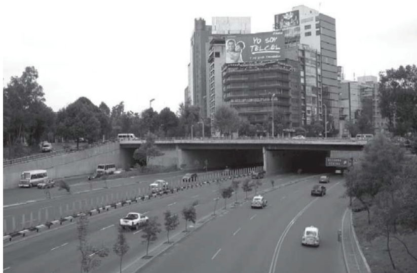
Foto 2. Circuito interior de la Ciudad de México.

De manera que la imagen urbana se construye a partir de los elementos que son identificados por los habitantes, tanto físicos como sociales, que están íntimamente relacionados no sólo a través de las actividades que los habitantes realizan sobre los elementos físicos, sino también a través de los