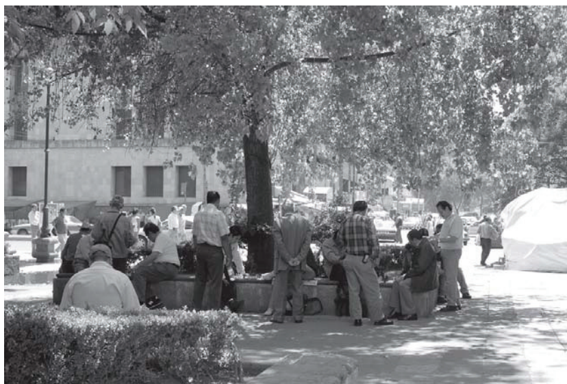
Foto 3. Plaza de la Solidaridad, Ciudad de México.

La diferencia entre el imaginario urbano y la imagen urbana es la siguiente: mientras que la imagen urbana existe solamente en el ámbito simbólico como representación del espacio urbano