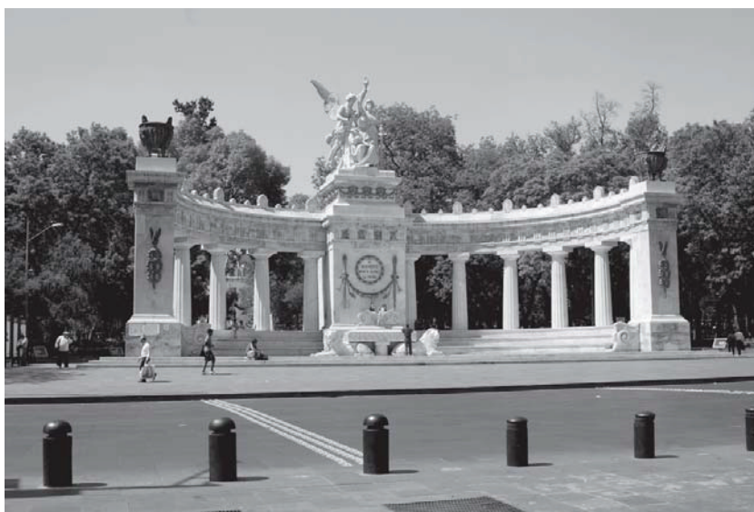
Foto 6. Hemiciclo a Juárez, punto de referencia en la Ciudad de México.

La técnica de flanear ayuda a caracterizar al sitio de estudio junto con un análisis etnográfico de la vida cotidiana que alberga y la descripción extraída de documentos que hablen sobre este espacio urbano como artículos, planes parciales de desarrollo, datos estadísticos del Sistema para la Consulta de Información Censal (SINCE) y fotografías