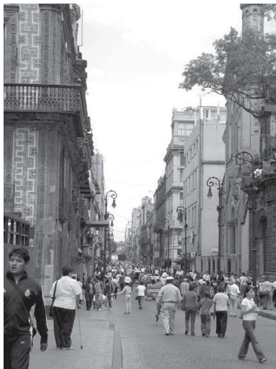
Foto 1. Av. Francisco I. Madero, Ciudad de México.

Para estructurar esta visión del espacio urbano la persona se vale de dos aspectos básicos que utiliza para captar y procesar la información del espacio urbano: los sentidos y la memoria. Por una parte, los ciudadanos que habitan en un espacio no sólo utilizan el sentido de la vista para captar información, sino que también la reciben utilizando los otros cuatro sentidos (el olfato, el tacto, el oído y el de orientación), que también relacionan a la ciudadanía con su espacio, recibiendo mensajes e instrumentando respuestas, que ayudan a captar los elementos que integran el espacio urbano; de ahí el carácter polisensorial de la percepción (Martínez, 1994:11-12).