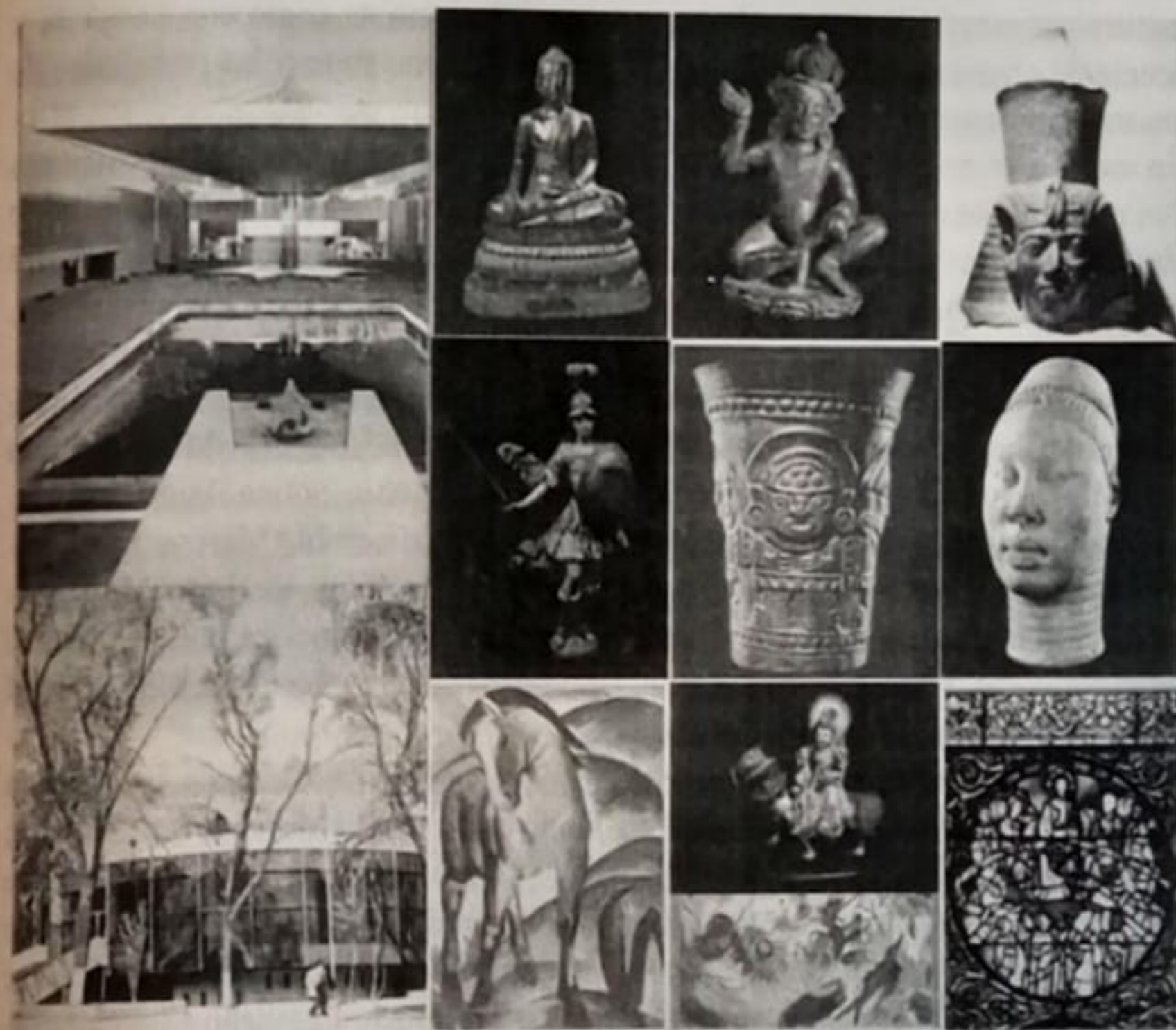
Figura 3. Exposición de Obras Selectas del Arte Mundial