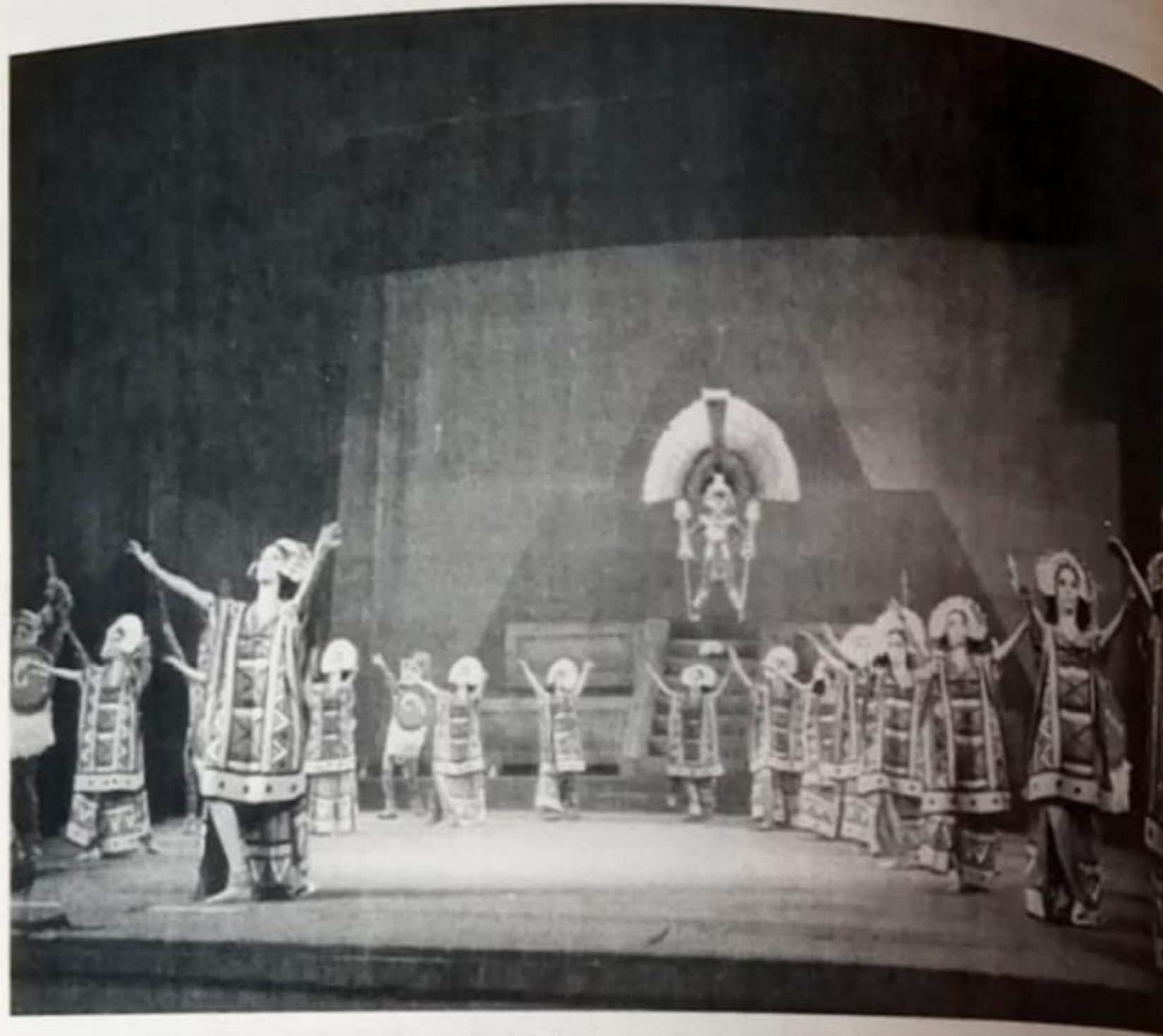
Figura 5. Festival Mundial de Folklor