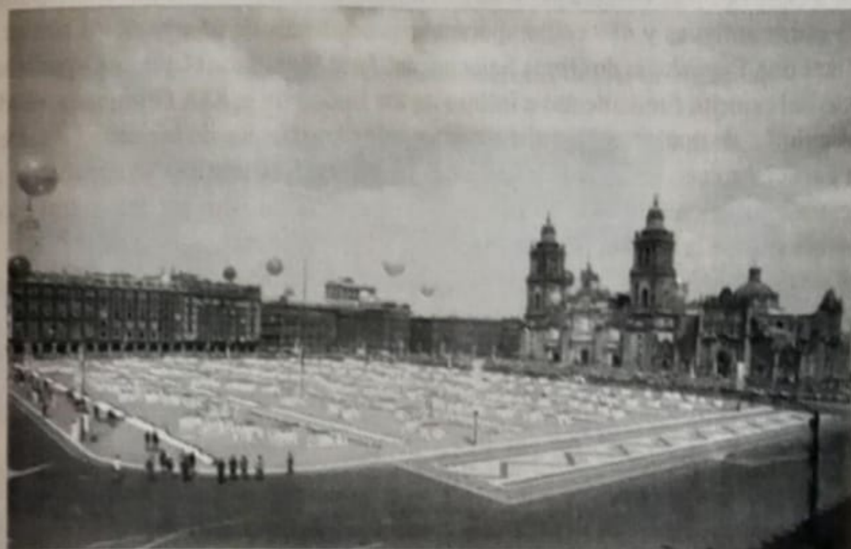
Figura 2. Recepción de la Juventud de México a la Juventud del Mundo

3. Campamento Olímpico de la Juventud. Éste se llevó a cabo del 8 al 27 de octubre en el Centro Vacacional del Instituto Mexicano del Seguro Social en Oaxtepec, Estado de Morelos. En este campamento se reunieron 831 jóvenes, de los cuales 525 eran hombres y 306 mujeres. En una época de fuerte discriminación racial y fricción entre diversas creencias, en este campamento pudieron convivir jóvenes de los cinco continentes, haciendo diversas actividades en torno a la cultura para culminar con una misa ecuménica con ministros de diferentes cultos, —ortodoxo, católico, judío, protestante y budista— presidida por el arzobispo de Cuernavaca Méndez Arceo. ( Ibid. , capítulo 3)